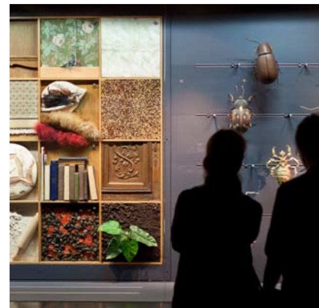
Musée national d'histoire naturelle – 'natur musée', collection permanente

Les couleurs ont-elles toujours existé ? Existent-elles réellement ? Sont-elles toujours présentes lorsque je ferme les yeux ? On est vite embarrassé lorsqu'on essaye de trouver une réponse précise à ces questions à priori banales. L'exposition temporaire du Musée national d'histoire naturelle tentera d'y apporter les bonnes réponses.