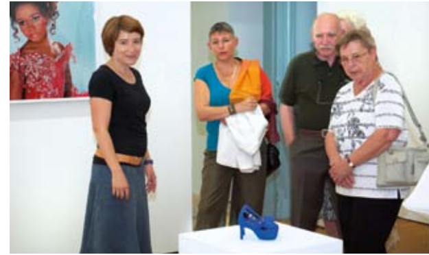
Casino Luxembourg – Forum d'art contemporain, vue de l'exposition Second Lives : Jeux masqués et autres Je

contexte socioculturel du Grand-Duché de Luxembourg et, vu l'obligation d'une exposition à la fin de la résidence, il se positionne davantage dans son rôle de plateforme de production et de création contemporaine.