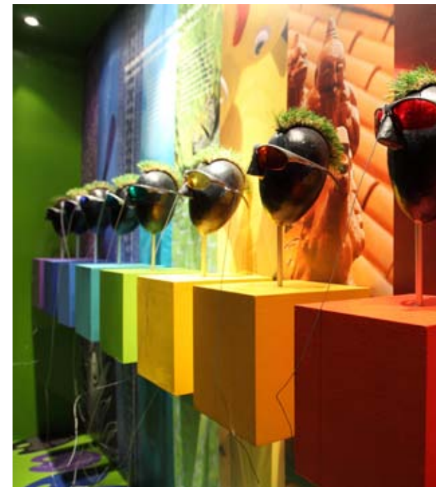
Musée national d'histoire naturelle, vue de l'exposition « Haut en couleurs », photo : MnhnL

10 h 30 Visite guidée de l'exposition « Haut en couleurs » (L)