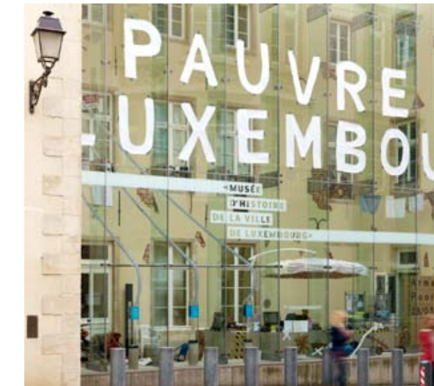
Musée d'Histoire de la Ville de Luxembourg, vue de la façade

L'exposition Pauvre Luxembourg ? permet de prendre la mesure des dimensions que revêt la pauvreté au Luxembourg et dans le monde, depuis l'époque de la formulation de la « question sociale » vers 1850 jusqu'à nos jours. Pour le Musée, c'est l'occasion de présenter des critères d'appréciation et de définition de la pauvreté et d'offrir une vue d'ensemble de cette question complexe.