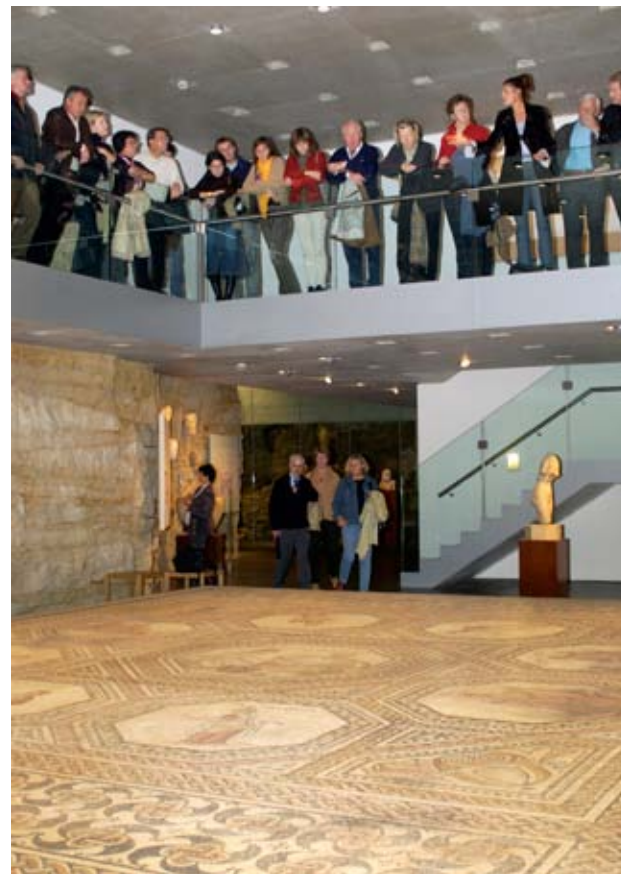
Musée national d'histoire et d'art, vue de la Mosaïque de Vichten, photo : Tom Lucas

Edward Steichen (1879-1973) est à juste titre considéré comme l'un des meilleurs photographes portraitistes du XX e siècle. Son travail dans ce domaine s'étend sur une période de trente ans, des images picturales – sensuelles et floues – publiées dans le magazine Camera Work aux portraits détaillés, nets et précis réalisés pour Vogue et Vanity Fair . À travers l'œuvre de Steichen, il est ainsi possible de suivre l'évolution du portrait photographique d'un outil documentaire vers une forme d'art indépendante. Tout au long de sa carrière exceptionnellement variée et longue, Steichen a toujours été à la recherche de l'individualité humaine. Il possédait cette capacité de tisser des liens solides entre ses œuvres et le spectateur. L'exposition donne un aperçu de cet aspect particulier de l'œuvre de Steichen en présentant une soixantaine de portraits sélectionnés dans la collection du musée.