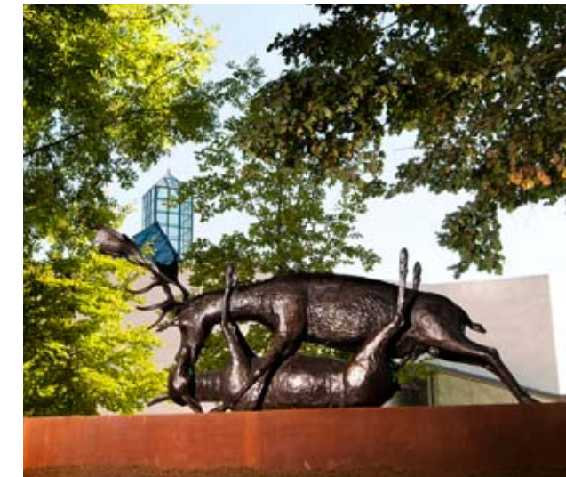
Park Dräi Eechelen, Wim Delvoys, Trophy , 1999, bronze, collection Musée national d'histoire et d'art

L'exposition est une invitation à parcourir la Collection Mudam à travers le thème du paysage. Ainsi, qu'il soit surdimensionné, pixellisé puis déployé à la manière d'un panorama par Xavier Veilhan, qu'il se fasse plus intime tel qu'esquissé dans les variations graphiques de Cy Twombly, ou qu'il soit fantasmé comme dans la peinture lumineuse de Christian Hidaka, le paysage semble être un territoire de recherches aux horizons fluctuants.