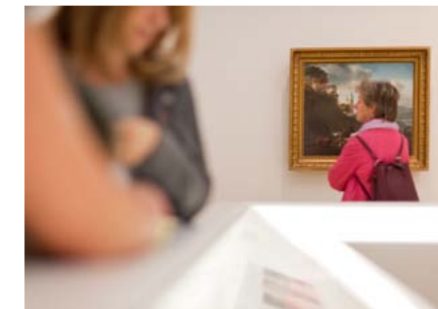
Villa Vauban-Musée d'Art de la Ville de Luxembourg, vue de l'exposition The Golden Age Reloaded

Dans l'imaginaire populaire, l'atelier d'artiste s'apparente à un lieu mythique, évoquant des images d'Épinal qui, pour la plupart, remontent au 19 e siècle. En réponse aux bouleversements sociaux et technologiques engendrés par la révolution industrielle, les peintres instrumentalisent leur lieu de travail pour propager une vision idéalisée de la pratique artistique, censée souligner à la fois son caractère unique et son importance sociale.